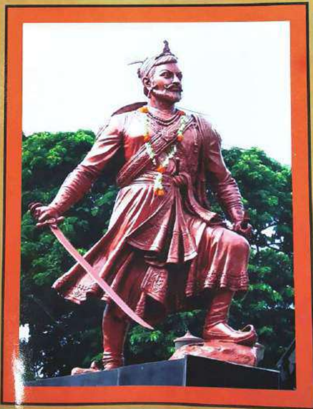
छत्रपती संभाजी महाराज