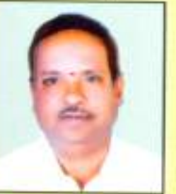
श्री. माळवतकर महेश शिवाजीराव वार्ड क्र. १७