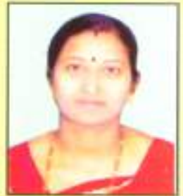
श्रीमती शिंदे किर्ती महेंद्र वार्ड क्र. ३६