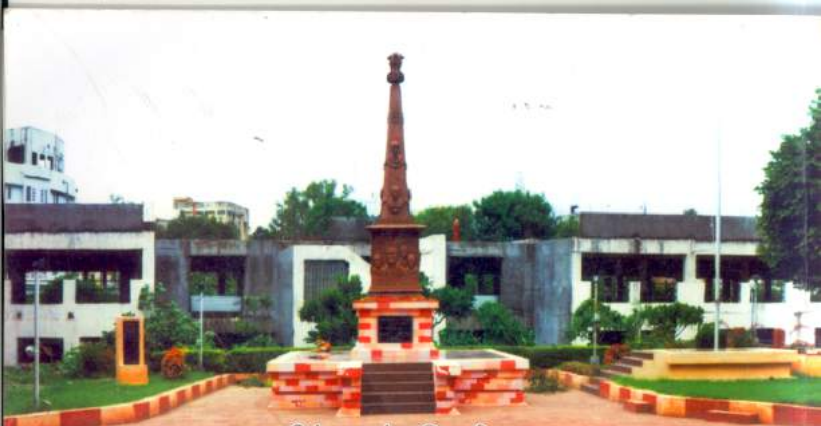
मुक्तीसंग्राम स्तंभ-सिद्धार्थ उद्यान