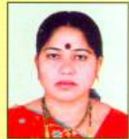
श्रीमती गांगवे कौशलबाई बन्सीलाल वार्ड क्र. ७६