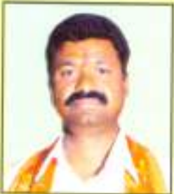
श्री. जाधव जानोबा पांडुरंग वार्ड क्र. ६