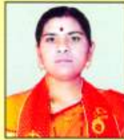
श्रीमती वेताळ छाया साईनाथ वार्ड क्र. ९९