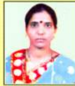
श्रीमती निरपवारे पुण्या कांतीलाल वार्ड क्र. ७१