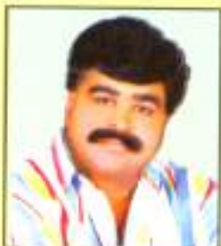
श्री. बनकर कृष्णा सांडुजी वार्ड क्र. ७